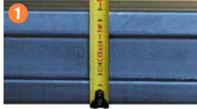
TAVAN VE TABAN ARA KAYIT 90mm Galvaniz Tavan ve Taban Ara Kayıt