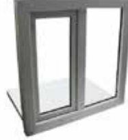
PENCERE 990x1000mm U Kasa Pvc Pencere