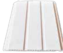
LAMBİRİ 10mm Kalınlığında Pvc Lambiri