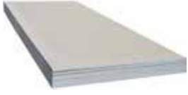
BETOPAN 14mm Alt Taban Betopan Kaplaması