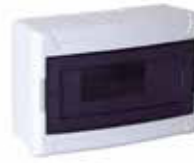
SİĞORTA KUTUSU TSE'li 4-6-8-12'li Kapak Sıva Üstü