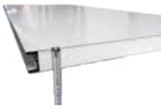
SANDVIÇ PANEL 50mm Sandviç Panel