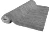
MİNEFLO 3mm Mineflo Yer Döşemesi