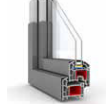
ISI CAM 4+12+4 mm Isı Cam