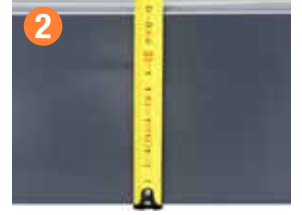
TABAN ŞASE 130mm Galvaniz Taban Şase