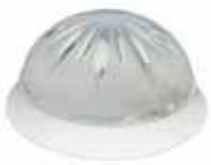
İÇ GLOP İç Aydınlatmalar