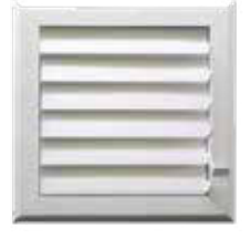
MENFEZ 350x450mm Menfez