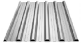
TRAPEZ SAÇ 0,5-0,6mm Özel Profil Galvaniz Saç