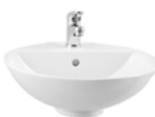
LAVABO Seramik Lavabo