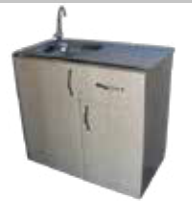
MUTFAK DOLABI 45x85 Krom Evelyeli Suntalem Alt Dolap