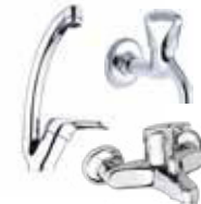
MUSLUKLAR Banyo Bataryası ve Musluklar