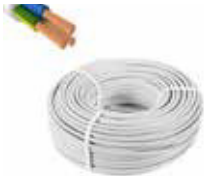
KABLOLAR NYM 3x1,5 - 3x2,5mm 2 (TSE - ISO) Kablolar