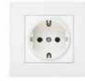
PRİZ TSE'li Sıva Üstü Priz