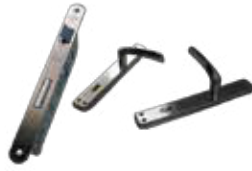
KAPI KİLİDİ & KOLU Kapağı Kilidi ve Kapağı Kolu