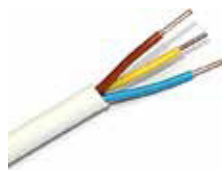
NYM KABLO 240 Volt Kapasiteli 1034 NYM Kablo