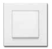
ANAHTAR TSE'li Sıva Üstü Anahtar