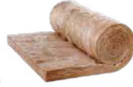
CAM YÜNÜ 50mm Kalınlığında Cam Yünü