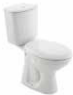
KLOZET Alafranga Kale İda Klozet Seti